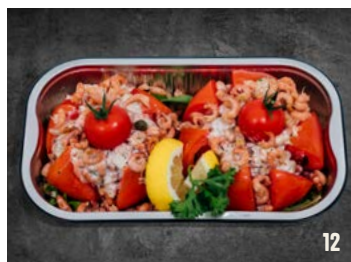
2 TOMAAT GARNAAL per schaal € 12,95