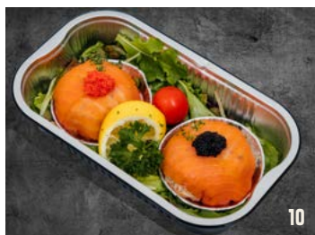
2 ZALMBONBON per schaal € 15,99

Prijswijzigingen voorbehouden. Aanbiedingen mits onverkocht. Prijzen geldig t/m 31-12-2022