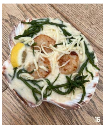
GEGRATINEERDE COQUILLE per stuk € 5,99 met roomsaus, zeekraal en geraspte kaas

ONDERSTAANDE GERECHTEN WORDEN GESERVEERD MET PUREE EN GESTOOMDE GROENTEN