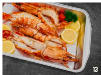
4 REUZE GAMBA IN DE LOOK per schaal € 34,95