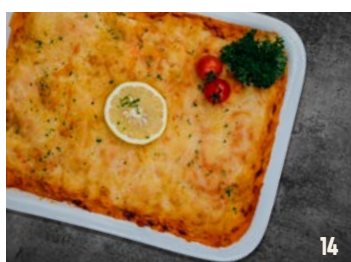
VISPAN per schaal € 16,95 (genoeg voor 2-3 pers.)