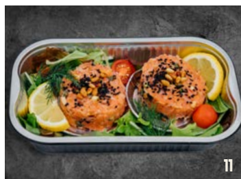
2 ZALMTARTAAR per schaal € 15,99