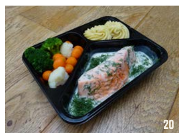
ZALMFILET IN DILLEROOMSAUS per schaal € 10,95