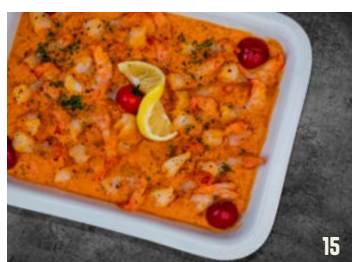
SCAMPI DIABOLIQUE per schaal € 24,95