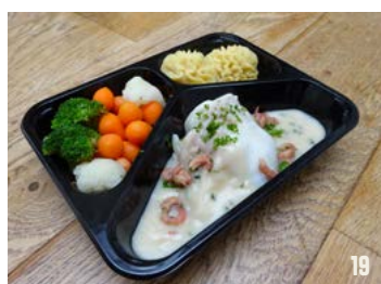
KABELJAUWHAAS IN BIESLOOKROOMSAUS per schaal € 11,95