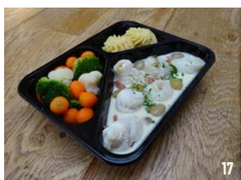
TONGROLLETJES IN WITTE WIJNSAUS per schaal € 9,95

ONDERSTAANDE GERECHTEN WORDEN GESERVEERD MET PUREE EN GESTOOMDE GROENTEN