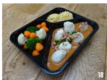
TONGROLLETJES IN HUISGEMAAKTE VISSAUS per schaal € 10,95